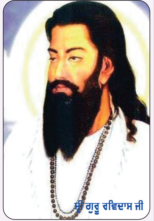
ਸ੍ਰੀ ਗੁਰੂ ਰਵਿਦਾਸ ਜੀ

ਫੈਡਰੇਸ਼ਨ ਆਫ ਅੰਬੇਡਕਰਾਇਟਸ ਐਂਡ ਬੁੱਧਿਸਟ ਔਰਗੇਨਾਈਜੇਸ਼ਨ ਯੂ. ਕੇ. ਦੇ ਉਪਰਾਲਿਆਂ ਸਦਕਾ ਲੰਡਨ ਸਥਿਤ ਭਾਰਤ ਰਤਨ ਬਾਬਾ ਸਾਹਿਬ ਡਾ. ਭੀਮਰਾਓ ਰਾਮਜੀ ਅੰਬੇਦਕਰ ਹਾਊਸ ਨੂੰ ਮਹਾਰਾਸ਼ਟਰ ਸਰਕਾਰ ਵੱਲੋਂ ਖਰੀਦੇ ਜਾਣ ਤੇ ਸ੍ਰੀ ਗੁਰੂ ਰਵਿਦਾਸ ਟੈਂਪਲ ਯੂਬਾ ਸਿਟੀ (ਕੈਲੇਫੋਰਨੀਆ) ਦੀ ਪ੍ਰਬੰਧਕ ਕਮੇਟੀ ਅਤੇ ਸੰਗਤਾਂ ਵੱਲੋਂ ਲੱਖ ਲੱਖ ਵਧਾਈਆਂ